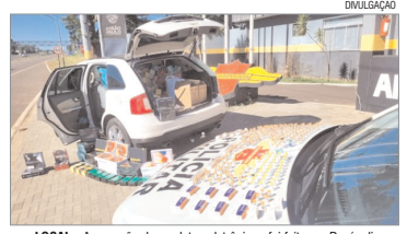
LOCAL - Apreensão de produtos eletrônicos foi feita em Penápolis

O homem de 41 anos que conduzia o veículo já possuía antecedentes criminais e foi preso em flagrante. A passageira que estava