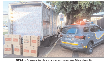
OCAL - Apreensão de cigarros ocorreu em Mirandópolis