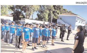
FORMAÇÃO - Projeto da Prefeitura é voltado para a formação cidadã de crianças entre 7 e 11 anos

"O projeto Anjos da Guarda representa o me-