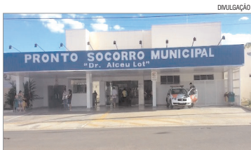
LEVADO - Bebê foi levado ao pronto-socorro de Birigui e aguardava transferência para hospital

Segundo a Polícia Militar, no local, o motorista do carro informou que passava pela via quando o bebê saiu da calçada em direção à rua e bateu na lateral esquerda do veículo. Com o impacto, a vítima