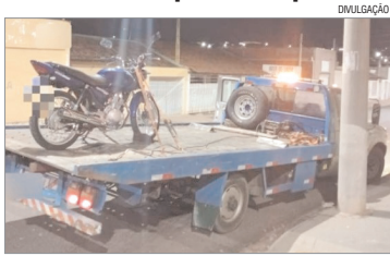
APREENSÃO - Ao todo, quatro motos foram apreendidas e levadas ao pátio de habilitação e outras irregularidades. Foram removidas 4 motos ao pátio.

90 veículos foram fiscalizados e 82 testes passivos de bafômetro foram realizados. A fiscalização resultou em 14 autos de infração de trânsito por irregularidades como escapamento irregular, recusa ao teste de bafômetro, ausência da carteira