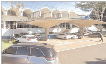
LOCAL - Audiência será na própria prefeitura, no Salão Azul