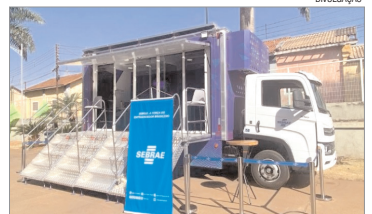
ATENDIMENTO - Sebrae Móvel estará em Coroados na quarta e na quinta-feira

"O Sebrae Móvel aproxima os empreendedores dos serviços e orientações do Sebrae. É uma oportunidade