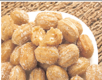
Misture a canela e o açúcar, depois passe nos churros fritos.

Modo de preparo: 20min Em uma panela, adicione o leite, a água, a manteiga e o sal. Quando o leite ferver, adicione a farinha de trigo e mexa rápido até a massa soltar do fundo da panela. Coloque a massa em um saco de confeiteiro com o bico pitanga, depois faça trinhas com a massa e frite.