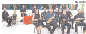
ATRAÇÃO - Banda Municipal Bruno Zago é atração hoje na Emeb Antônio Rodrigues Martins Neto

O nome Mosaico de Inverno foi escolhido para representar a diversidade de expressões que compõem o evento. Assim como um